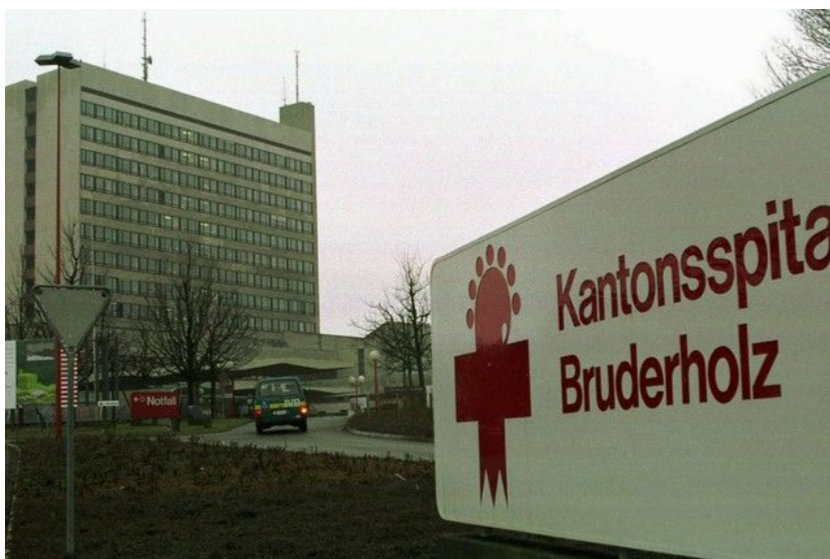
Bruderholzspital: 4200 Unterschriften gegen den Abriss.

Über die Schliessung des Bruderholzspitals entscheidet das Baselbieter Volk: Mit 4200 Unterschriften hat ein überparteiliches Komitee am Montag die Volksinitiative «Ja zum Bruderholzspital» eingereicht. Diese will die medizinische Grundversorgung im Kanton im bisherigen Rahmen sichern. Von sda