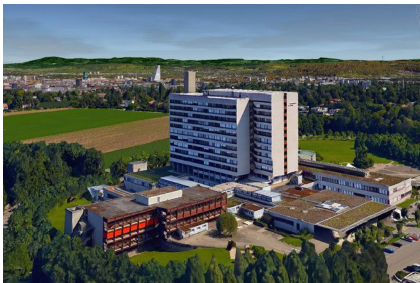
36 Angestellte der Frauenklinik haben keine Zukunft im Bethesda Spital.

In wenigen Monaten wird die Frauenklinik vom Bruderholzspital ins Bethesda Spital ausgelagert. 58 Angestellte der Frauenklinik werden im Bethesda weiter beschäftigt – für 36 gibt es keine Lösung. Von Yen Duong